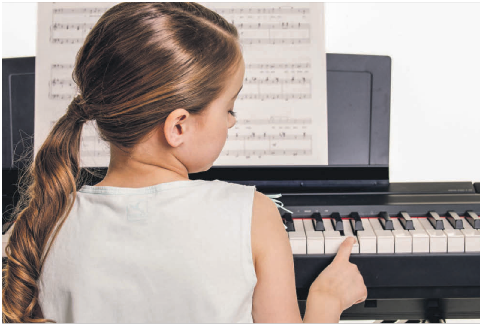
Besser mit einem Finger spielen als gar nicht – Hauptsache, es macht Spaß.