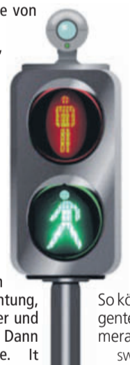
So könnte die intelligente Ampel mit Kamera aussehen. SWP Illustration/Krapp

London, sagt die Behörde, sei die erste Stadt, die das entsprechende System namens Scoot testet. An zwei belebten Überwegen in der Nähe von U-Bahn-Stationen wurden die notwendigen Gerätschaften angebracht. Bleibt die Befürchtung, dass sich die Einheimischen verhalten wie immer und grundsätzlich bei Rot über die Straße gehen. Dann schaltet Scoot auf Dauergrün – für die Fahrzeuge. It